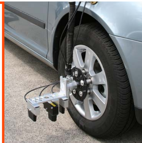
DCA System mit SFII Sensor

** optional, unter Verwendung von Rad- inkrementalgeber, Art.nr. 11355