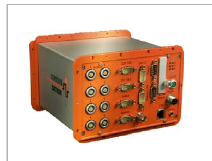
μEEP-12-8 (8 analoge Kanäle)

Die Betriebssoftware setzt neue Standards; sie führt den Nutzer durch seine Anwendung und enthält bereits verschiedene Standardtests. Mit der Software können auch Tabellen und Kundenberichte generiert werden. Der Nutzer hat die Möglichkeit, alle Funktionen zu modifizieren und kann so individuelle Tests erstellen.