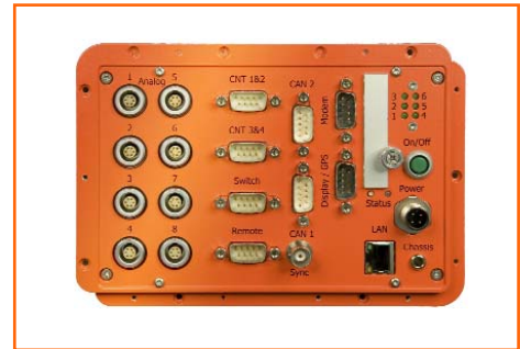
μEEP 12 - 8Kanal-Version