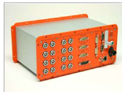
μEEP-12-16 (16 analoge Kanäle)