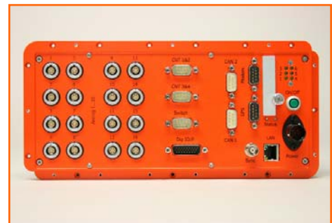
μEEP 12 - 16Kanal-Version